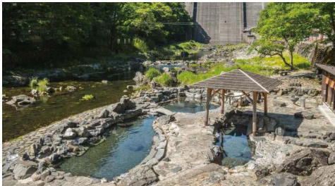
真庭観光局サイトから転載